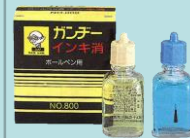
ガンジーインキ消し 【ボールペン用】No800 丸十化成(株)