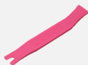
ハンディリムーバー AP201-CF 京都機械工具(株)