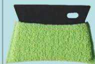
水垢とりスキージー W596 (株)マーナ