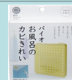
バイオ お風呂のカビきれい (株)コジット