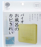
バイオ お風呂のカビきれい (株)コジット