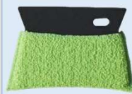
水垢とりスキージー W596 (株)マーナ