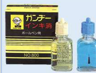
ガンジーインキ消し 【ボールペン用】No800 丸十化成(株)